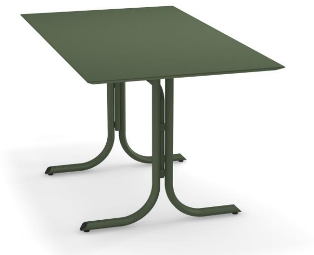
Table System ist die innovative Tischkollektion, entworfen im EMU Forschungs-zentrum, um den vielfältigen Ansprüchen des Objektgeschäfts gerecht zu werden; ein umfassendes Sortiment aus runden, quadratischen und rechteckigen Tischen mit festen und abnehmbaren Tischplatten. Diese Serie zeichnet sich durch die vielseitigen Einsatzmöglichkeiten aus, wobei die Tische sich ganz natürlich in jede Umgebung einfügen und sich mit allen Stühlen der EMU-Kollektionen kombinieren lassen.