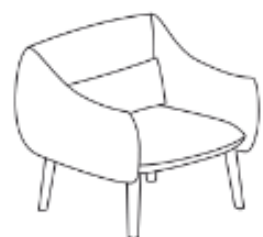
LU/1/DD 90 x 85 x 79 x 43