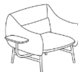
LU/1/RL/S 116 x 85 x 79 x 43