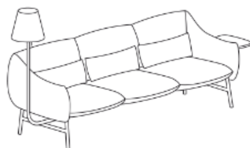
LU/3/RL/L/S 279 x 85 x 134 x 43