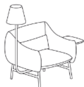
LU/1/RL/L/S 141 x 85 x 134 x 43