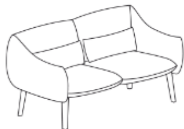
LU/2/DD 158 x 85 x 79 x 43