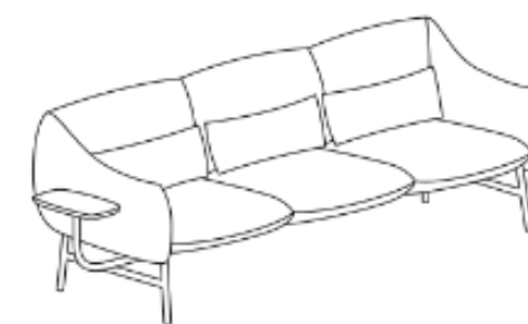
LU/3/RL/S 254 x 85 x 79 x 43 x 50