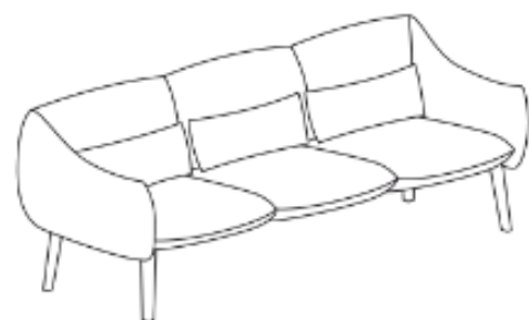
LU/3/DD 228 x 85 x 79 x 43