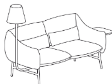
LU/2/RL/L/S 209 x 85 x 134 x 43