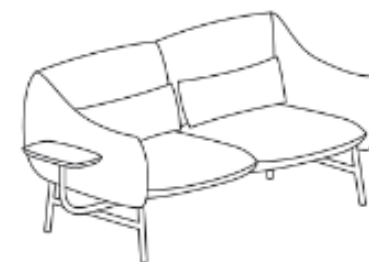
LU/2/RL/S 184 x 85 x 79 x 43