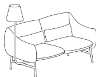
LU/2/RL/L 183 x 85 x 134 x 43